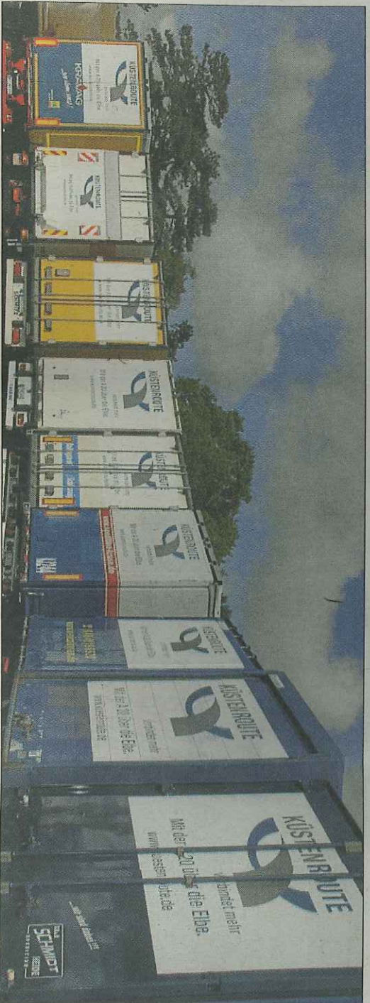
Ein Teil der Brummi-Flotte, die frisch beklebt auf den dringenden Wunsch nach A20 und Elbquerung hinweist.

Ideengeber Rainer Bruns wirbt mit einem kleinen Kleber auf seinem Wagen für den Ausbau der A20.